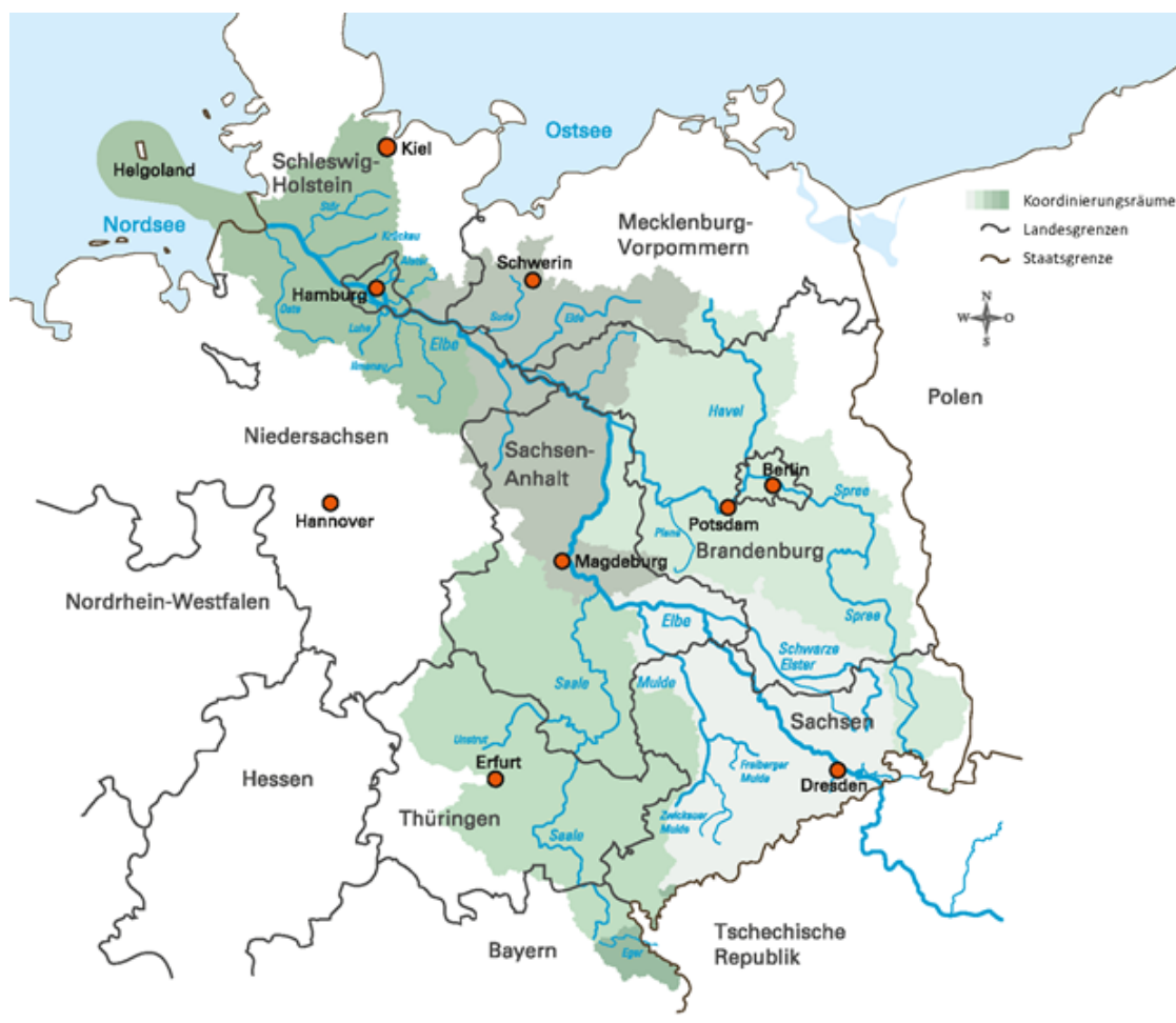
Abbildung 1: Das deutsche Einzugsgebiet der Elbe