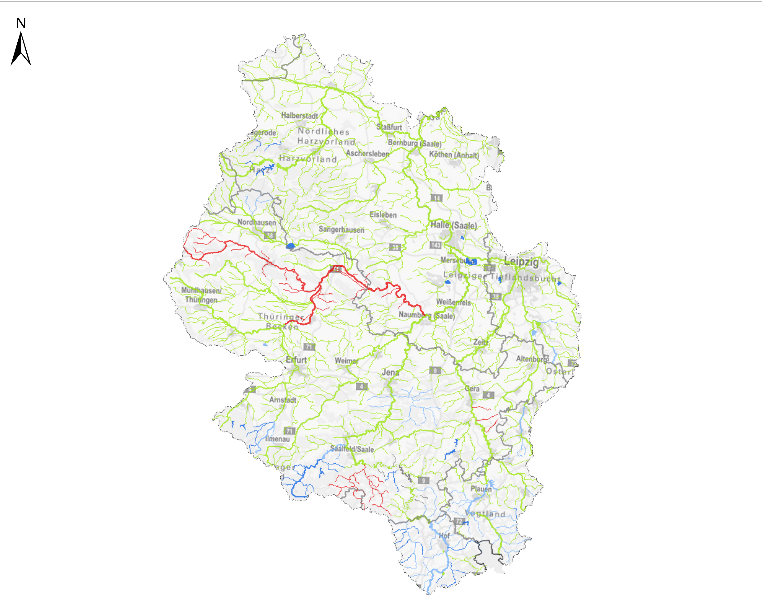
KOR Saale - Karte 5.1: Umweltziele der Oberflächenwasserkörper – Ökologie