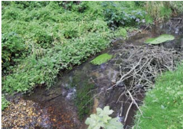
Totholz und Kies schaffen Ansiedlungsräume für Wasserpflanzen.

Die für die Pflanzung ausgewählten Bäche müssen den Wasserpflanzen hinsichtlich Wasserqualität und Struktur einen geeigneten Lebensraum bieten. Auch ausreichendes Licht ist eine Bedingung. Der Botanische Verein wählte deshalb vorrangig Gewässerabschnitte aus, in denen die Bezirksämter vor kurzem Maßnahmen zur Strukturverbesserung durchgeführt hatten.