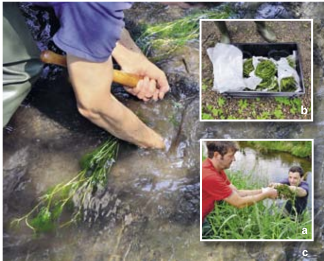
Gewinnung (a), Transport (b) und Pflanzung (c) von Wasserhahnenfuß.

An vier bis zu 75 Meter langen Strecken von Tarpenbek, Schleemer Bach, Engelbek und Wedeler Au pflanzte der Botanische Verein zu Hamburg e.V. im Juni 2011 insgesamt 500 Exemplare. Berle, Wasserstern und Wasserhahnenfuß wurden in die Bachsohle eingebracht und mit Kies fixiert. Der Botanische Verein beobachtet nun die langfristige Entwicklung der Pflanzen und ihre Ausbreitung.