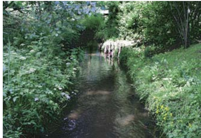
In strukturalarmen Abschnitten der Engelbek fehlen Wasserpflanzen.

Wasserpflanzen sind nach der Europäischen Wasserrahmenrichtlinie (EG-WRRRL) eine der biologischen Qualitätskomponenten zur Bewertung des ökologischen Zustands von Fließgewässern. 84 Prozent der Hamburger Fließgewässer sind nach den Kriterien der EG-WRRRL verbesserungsbedürftig. In der Hälfte dieser Gewässer fehlen Wasserpflanzen vollständig. Eine Verbesserungsmaßnahme muss daher die Förderung von Makrophyten sein.